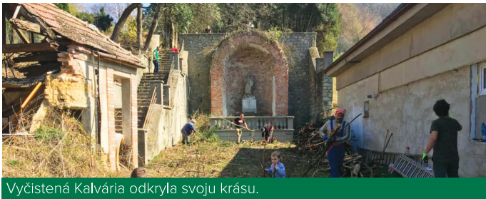
Vyčistená Kalvária odkryla svoju krásu.

Považujeme toto miesto za skutočný diamant obce. Žiarivý, pútajúci pozornosť, výnimočný poklad, miesto, ktoré nesie v sebe kus histórie a dokáže o našej obci vo svete rozpovedať zaujímavý príbeh.