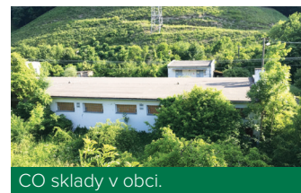
CO sklady v obci.

nahradený separovaním zo strany občanov. Dnes máme v obci veľkokapacitné kontajnery na sklo, šatstvo a na jedlé oleje. Na obecnom úrade a v zastupiteľstve vedíme diskusie o tom, ako by sa dal zberný dvor nahradiť. Jedným z navrhovaných riešení je odkúpiť priestory bývalých CO skladov od Ministerstva vnútra SR za 10 % z hodnoty znaleckého posudku, čo predstavuje sumu približne 50 000 EUR. Túto zmluvu máme už predrokovnú. Medzičasom však na Ministerstve vnútra SR pozastavilivšetky predaje v Západoslovenskom kraji, preto musíme počkať na „zelenú“ od ministerstva, aby sa tento predaj mohol zrealizovať.