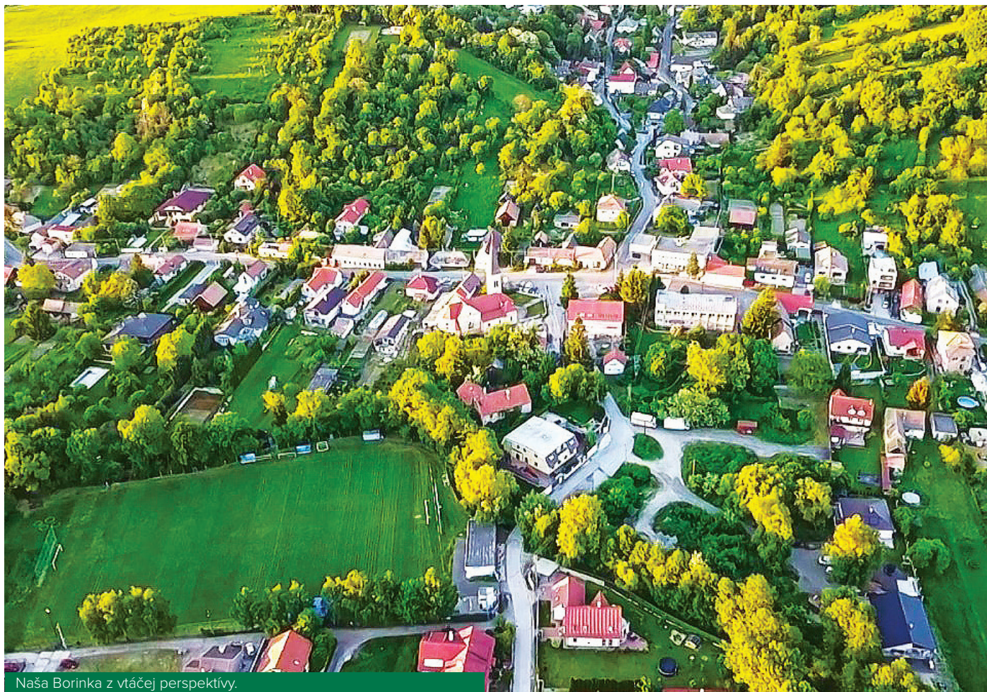
Naša Borinka z vtáčej perspektívy.