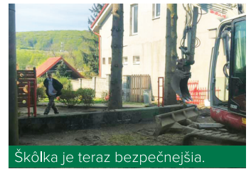
Škôlka je teraz bezpečnejšia.